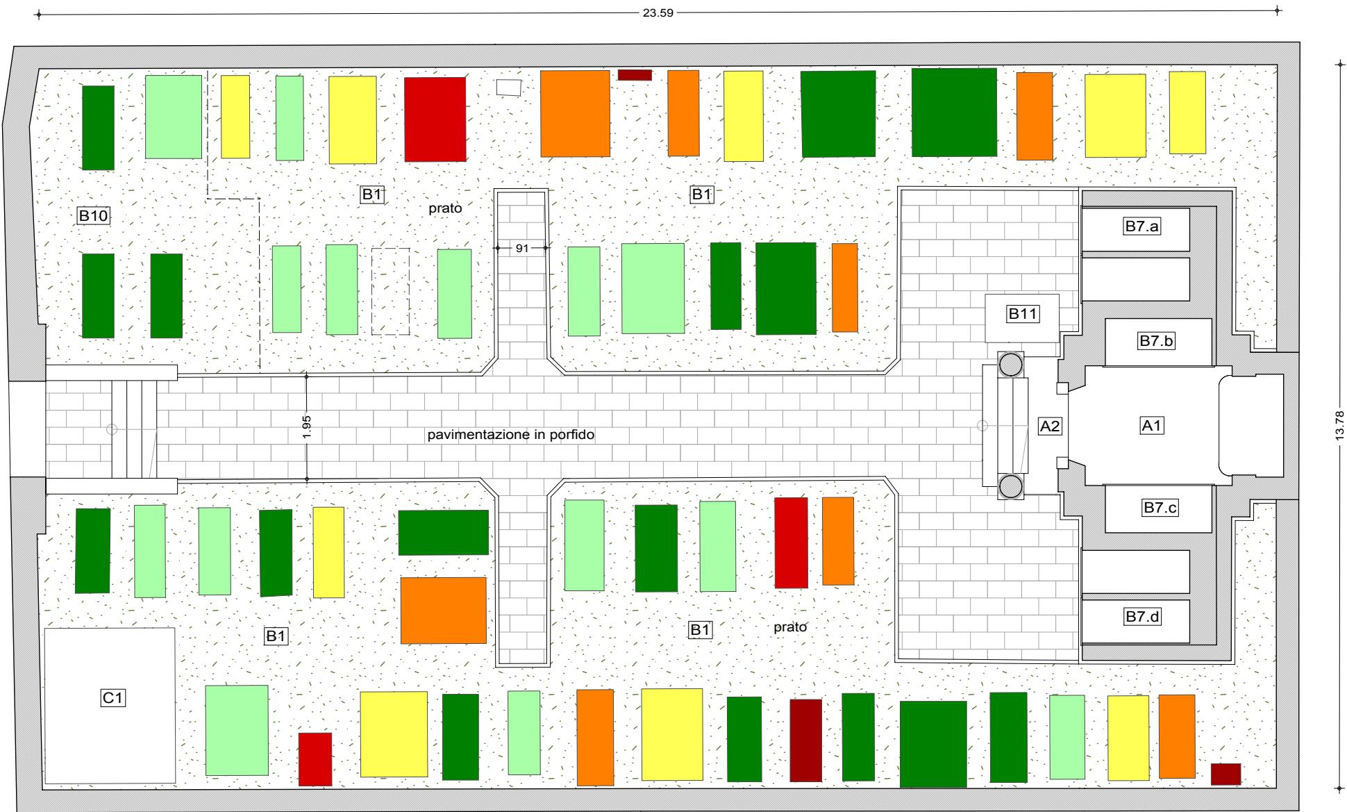
B7.a) PROSPETTO LOCULI INDIVIDUALI