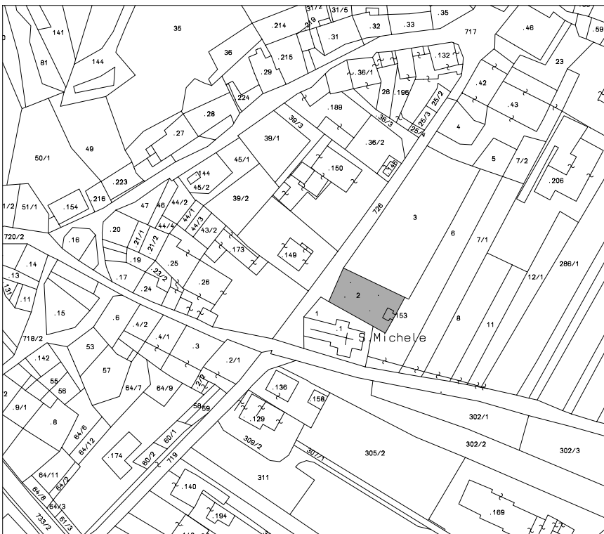
ESTRATTO MAPPA CATASTALE